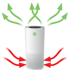
filtrace v rozsahu 360° s vysokou účinností