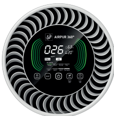
LCD dotykový displej